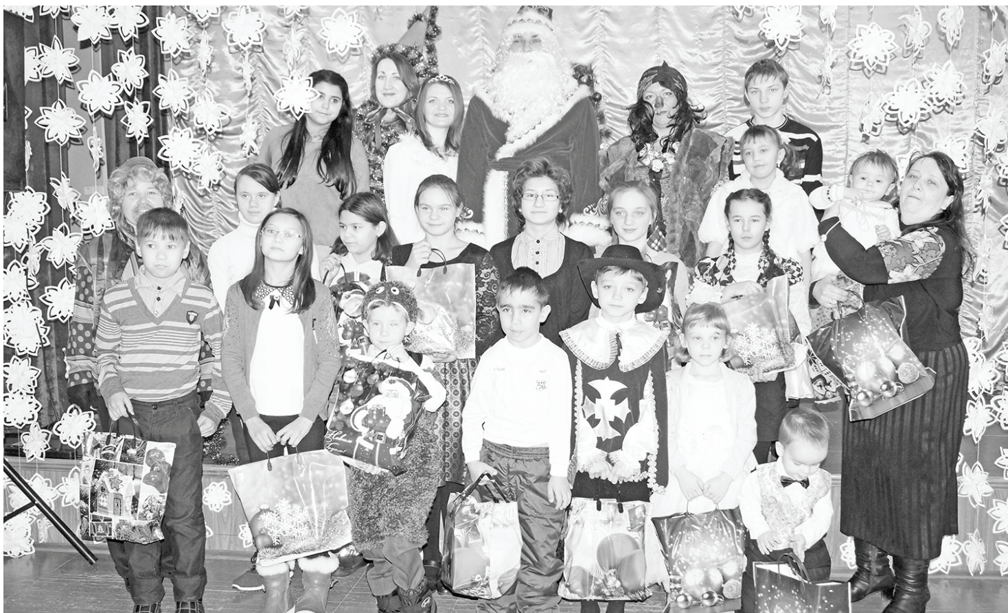
Участники утренника для замещающих семей.

ждать, и уже через несколько минут на пороге появился первый любитель чтения.