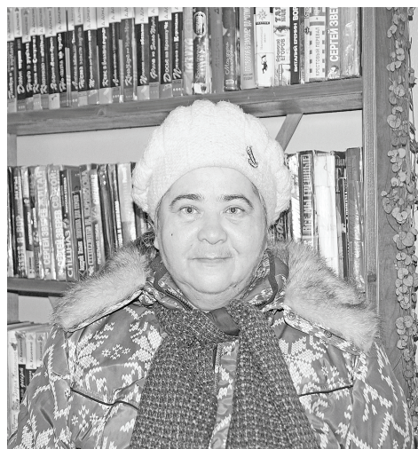
Первая читательница районной библиотеки 2017 года.